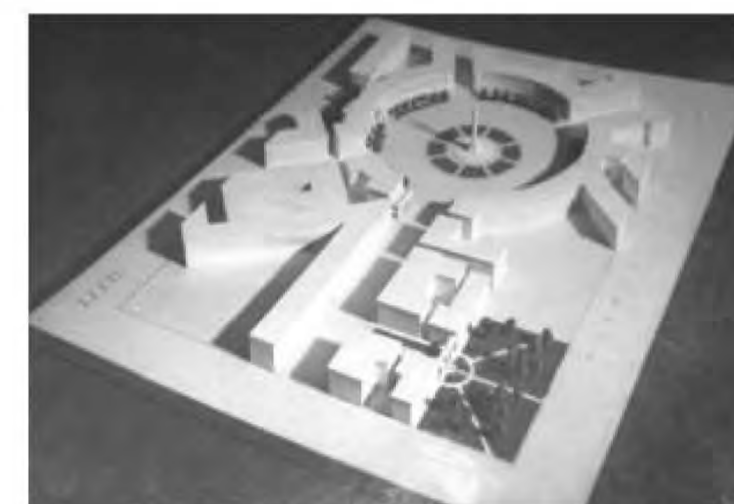
Илл. 4 Конкурсный проект реконструкции площади Мира под девизом «XXXVI». Макет. 1953г.