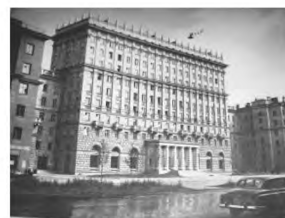
Илл. 13 Жилой дом в южной части проспекта имени И.В.Сталина.1953. Архитекторы М.Е.Русаков, В.М.Фромзель и инженер И. В. Максимов. Жилой 10-этажный дом на 138 квартир со встроенным двухзальным кинотеатром, современный адрес – Московский пр.,202. В 1954 г. на Всероссийском конкурсе на лучшие выстроенные жилые и гражданские здания за 1953 г. присуждена 2-я премия