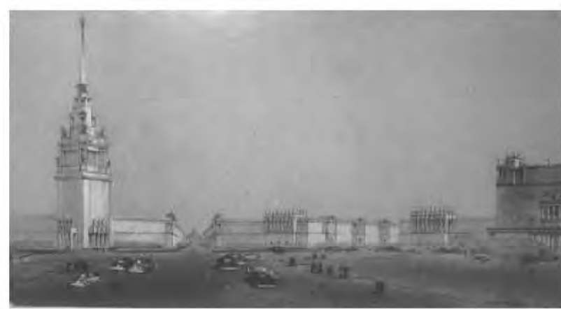
Илл. 10 Въездной ансамбль Конкурсный проект под девизом «Наш город» (2-я премия) Авторы: И.И.Фомин, Б.Н.Журавлев, С.Б.Сперанский, П.А.Арешев, В.С.Васильковский и др. 1953