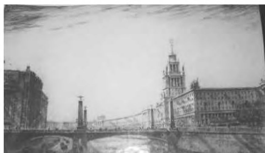
Илл. 2 Набережная Обводного канала. Конкурсный проект под девизом «XXXVI».1953г.