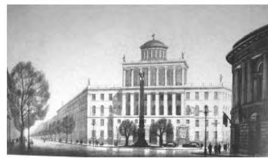
Илл.3 Эскизный проект реконструкции и застройки проспекта имени И.В.Сталина. Площадь у Технологического института. Авторский коллектив под руководством Б.Н.Журавлева, А.И.Наумова, И.И.Фомина. 1952г.