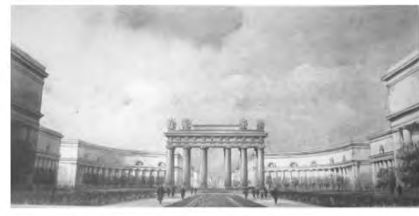
Илл. 11 Площадь у Сталинградского проспекта (совр. Лиговского пр.). Конкурсный проект под девизом изображение красного круга. 1953.