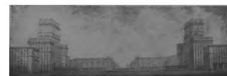
Илл. 8 Въездная площадь. Перспектива. Автор Радий Кухарский Дипломный проект (ЛИСИ). 1951