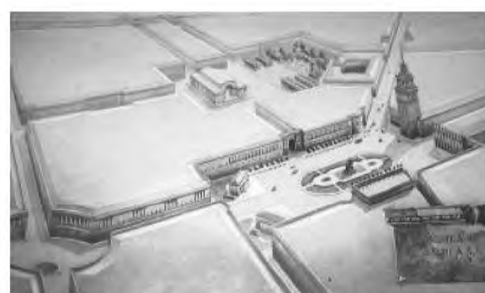
Илл.5 Конкурсный проект реконструкции площади Мира под девизом: изображение красного круга. 1953г.