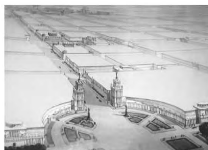
Илл.1 Въездная площадь. Перспектива. Проект 1952 г. Арх. Б.Н.Журавлев. Мастерская №6 «Ленпроект» вариант Б.