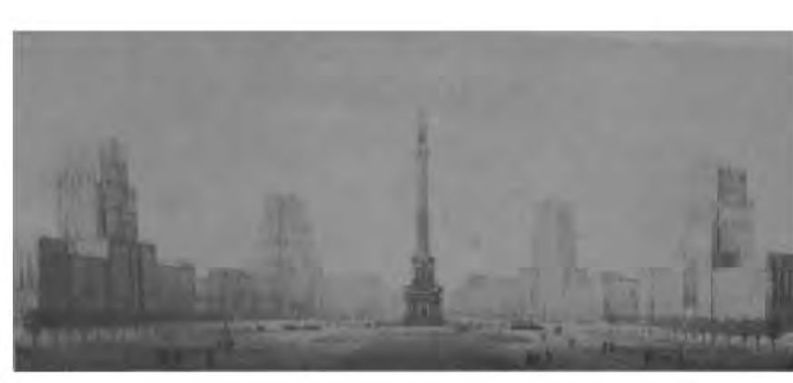
Илл. 6 Въездная площадь. Перспектива. Автор Илья Кусков. Дипломный проект (ЛИСИ). 1951