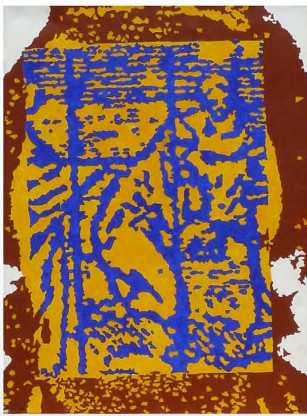
O. Liagatchev-Helgi. Portrait avec scène de l'Adoration. 2001. акрил, холст. 73 x 54