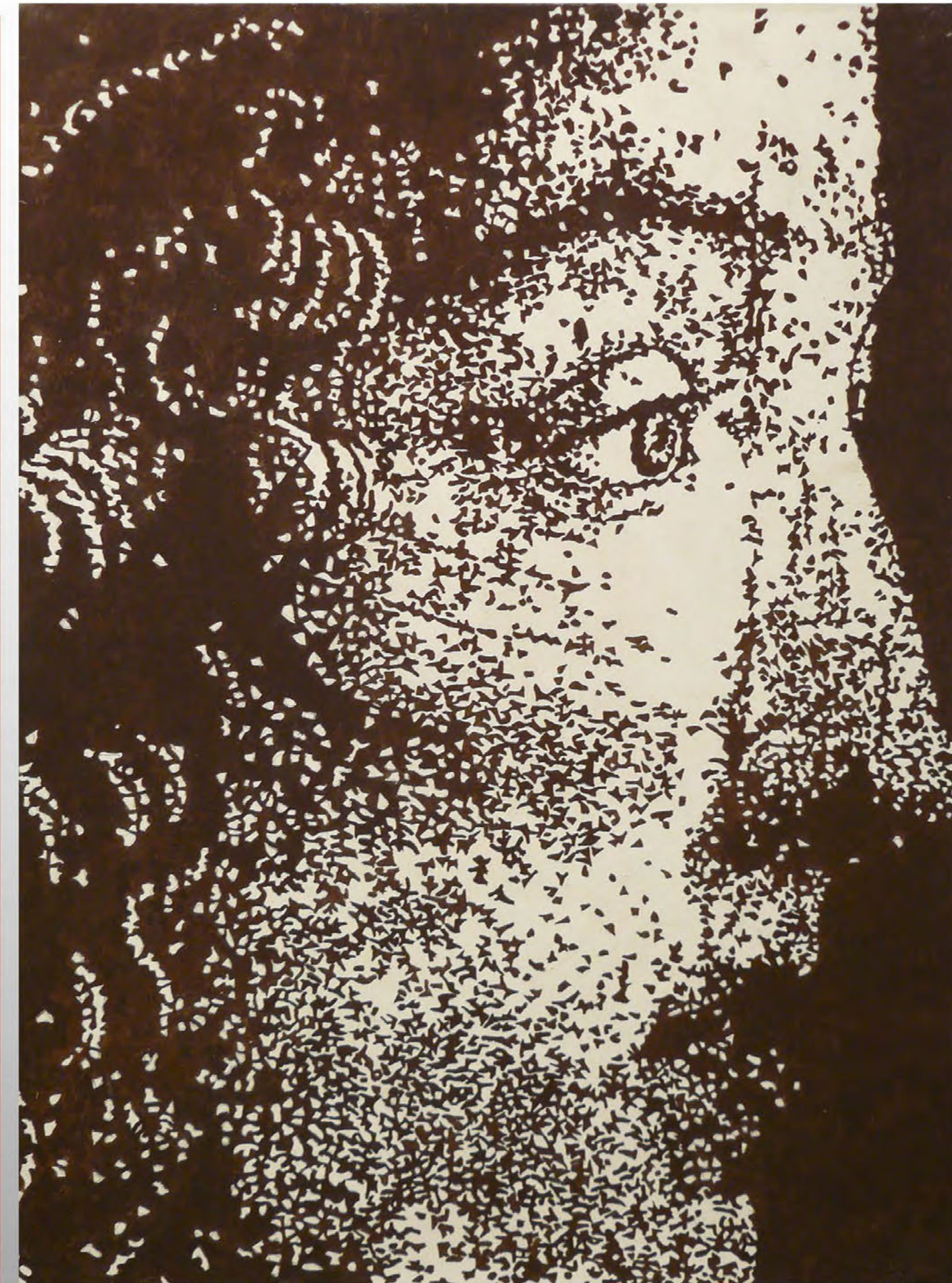
O. Liagatchev-Helgi. Botticelli. 1997, акрил, холст. 73 x 54