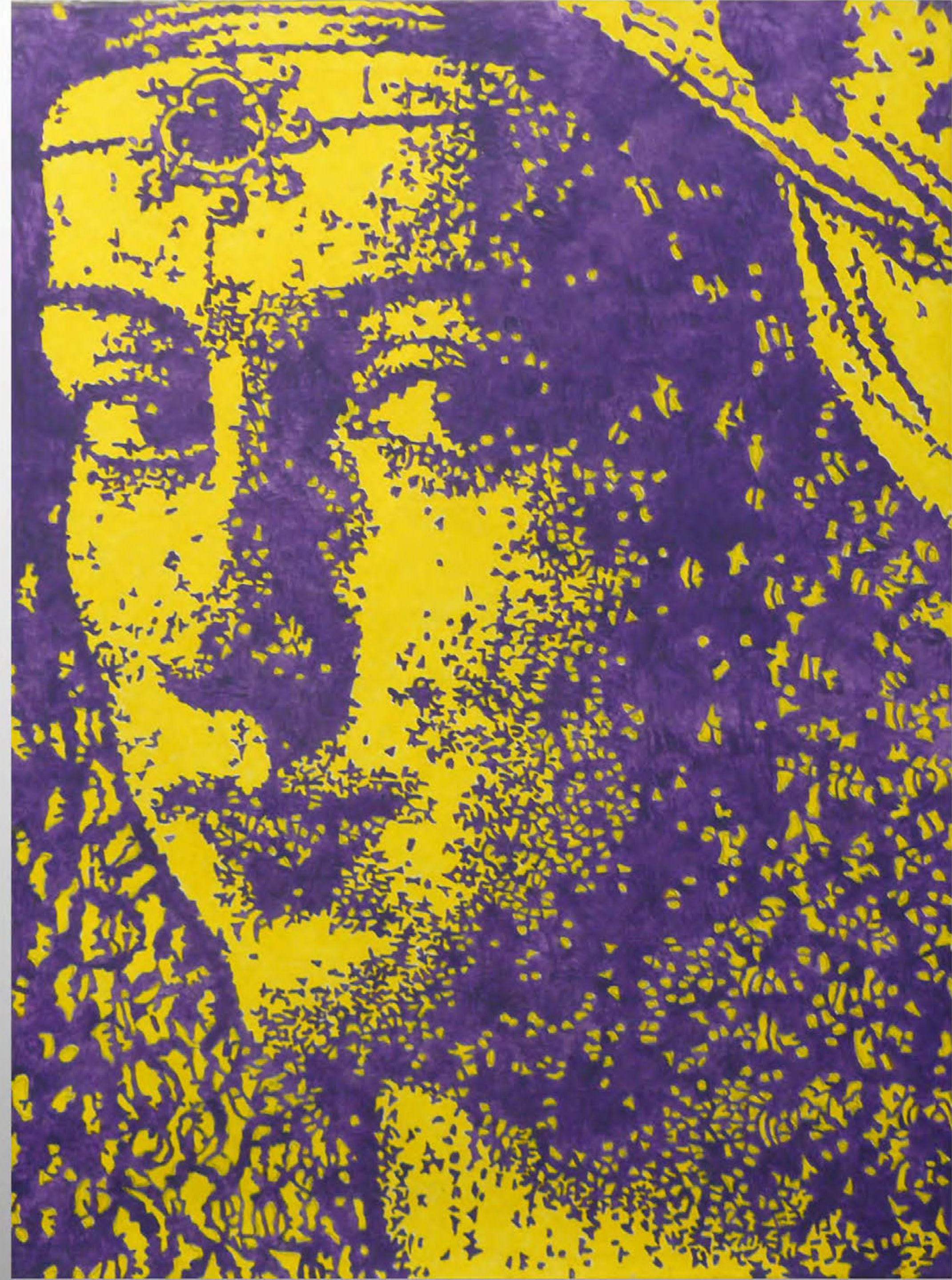
O. Liagatchev-Helgi. Renaissance. 1997. акрил, холст. 73 x 54

В XX веке творчество русских художников, живущих в Париже, становится изначально неотделимым от художественных процессов, проходивших в развитии европейского искусства. Ленинградский художник нон-конформист Олег Лягачев (Liagatchev-Helgi) начал в конце 1950-х гг. с увлечения различными проявлениями экспрессионизма, постепенно формируя собственный живописный метод, названный им семиотическим. Его переезд во Францию в 1975 г. не только не приводит к радикальной смене творческих ориентиров, но и наоборот способствует последовательному развитию семиотического метода, при котором живописная динамика сочеталась с разработанной системой знаков-кодов. Однако в условиях доминирования постмодернизма, с его стиранием границ своего и чужого, высокой и низкой культуры, установками на толерантность и признание ценности вторичного Лягачев включается в игру парижских арт-проектов.