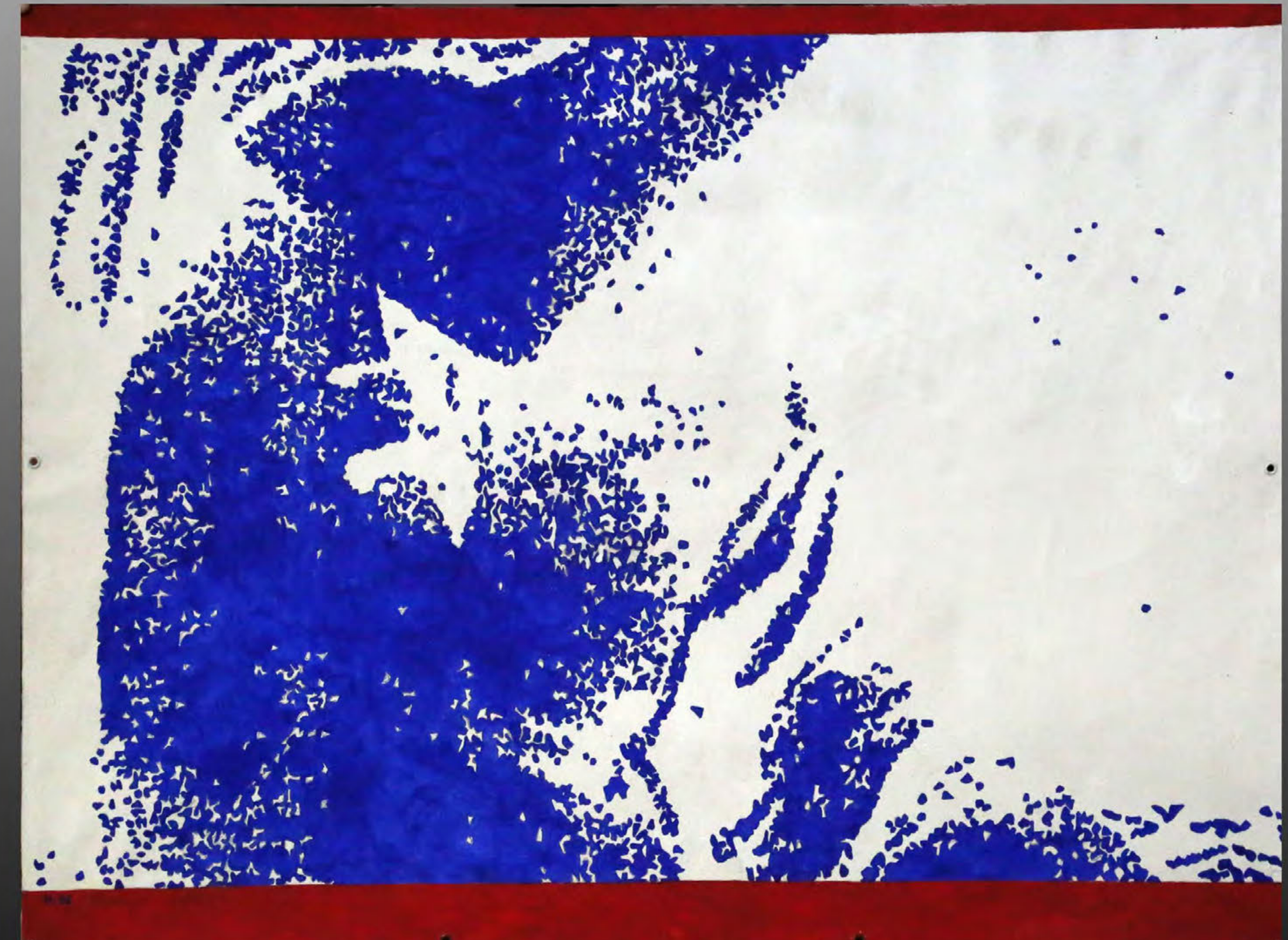
O. Liagatchev-Helgi. Opus 22 (II). Венера. 1996. акрил, холст. 58 x 76