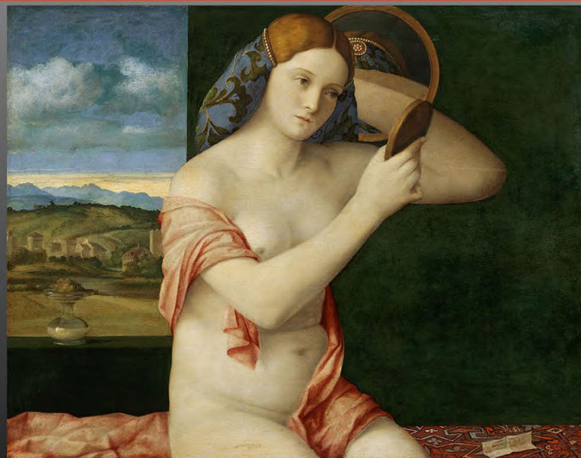
Дж. Беллини. Обнаженная перед зеркалом. 1514-16. 62 x 79. Музей истории искусства, Вена