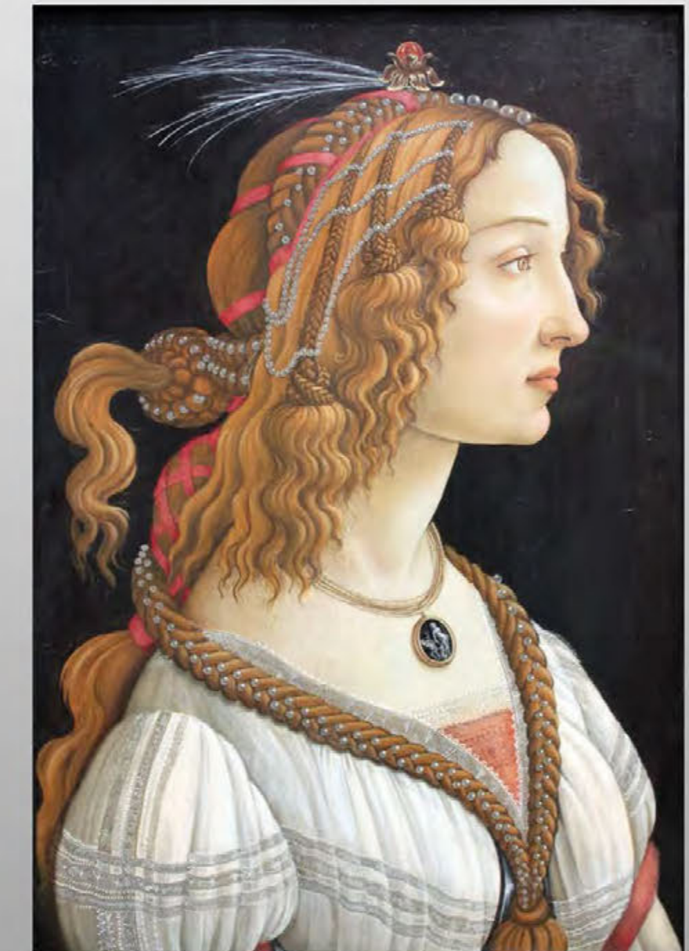
С. Боттичелли. Портрет молодой женщины. 1480-е. 82x54 Художественный институт Штеделя. Франкфурт-на-Майне.