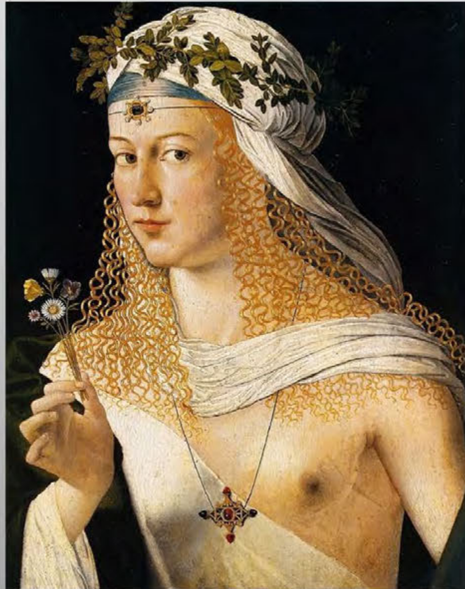
Б. Венто. Портрет Лукреции Борджиа (?) (Флора). 1512-1520. 44 x 34. Художественный институт Штеделя. Франкфурт-на-Майне