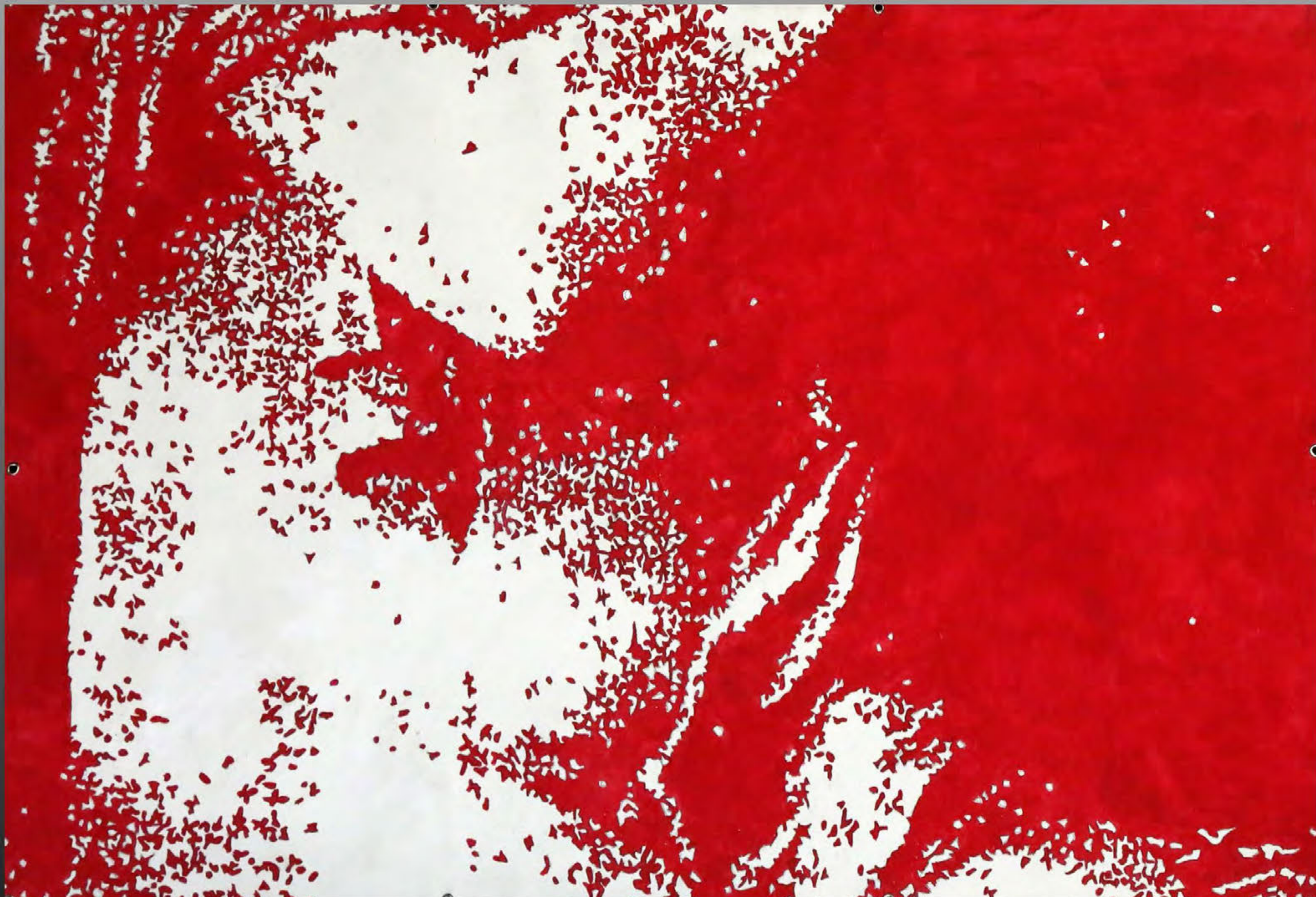
O. Liagatchev-Helgi. Opus 22 (I). Венера. 1996. акрил, холст. 51 x 75