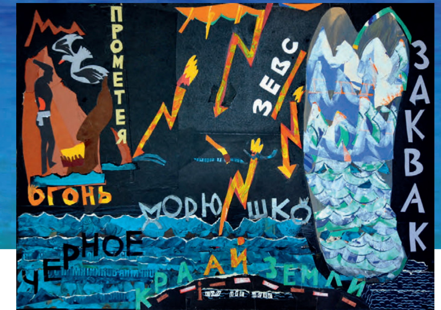
Огонь Прометея. 1989, коллаж (бумага, гуашь), 60x80

«Бессонница, Гомер, тугие паруса...», — эти стихотворные строки Осипа Мандельштама определяют основную тему морских странствий античных героев, которым петербургский художник Игорь Чурилов посвятил цикл коллажей и гравюр 1980 – 90-х гг.