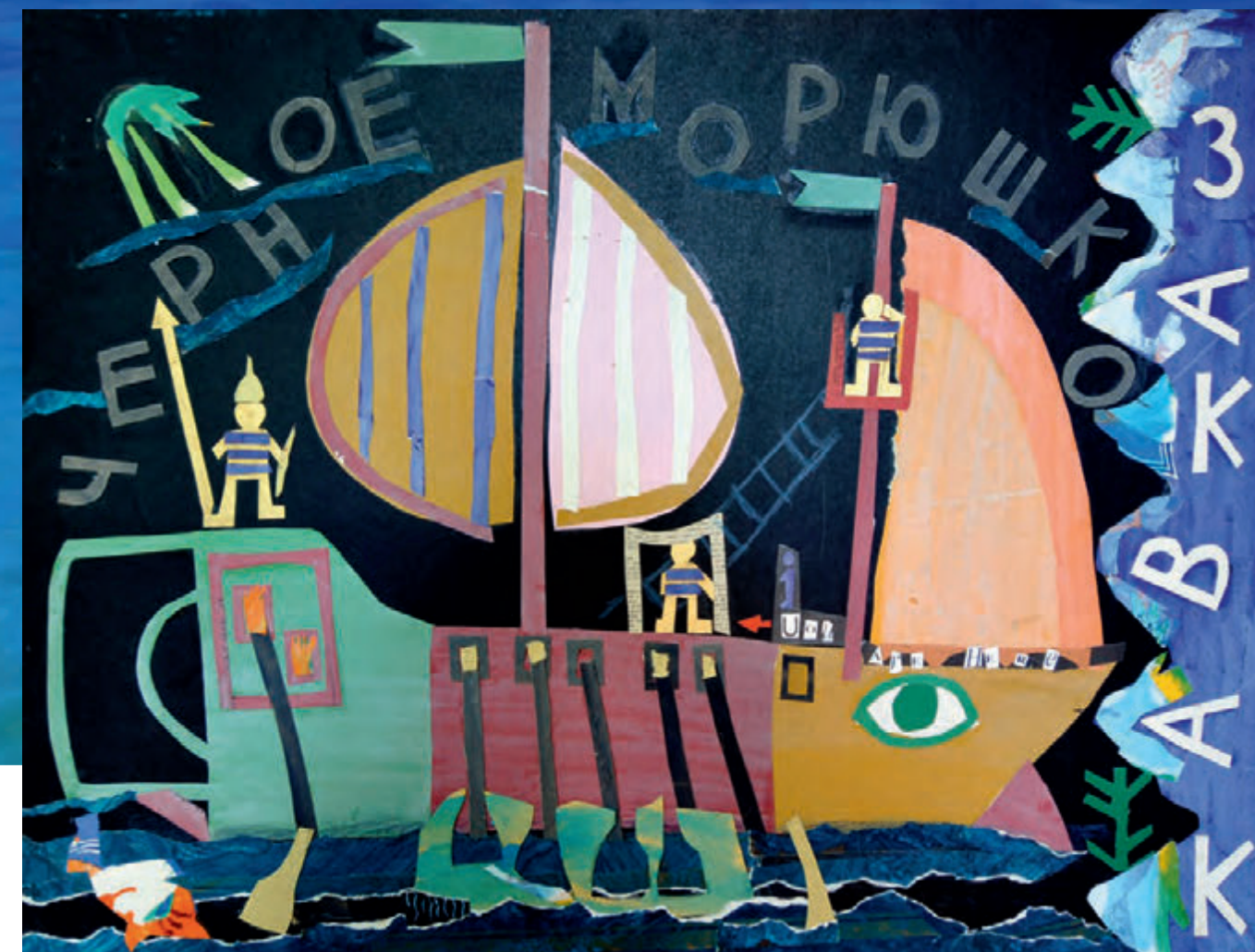
Аргонавты. 1989, коллаж (бумага, гуашь), 60x80

Электронная почта: artigorch@mail.ru Сайт: artigorch.wix.com/igorchurilov