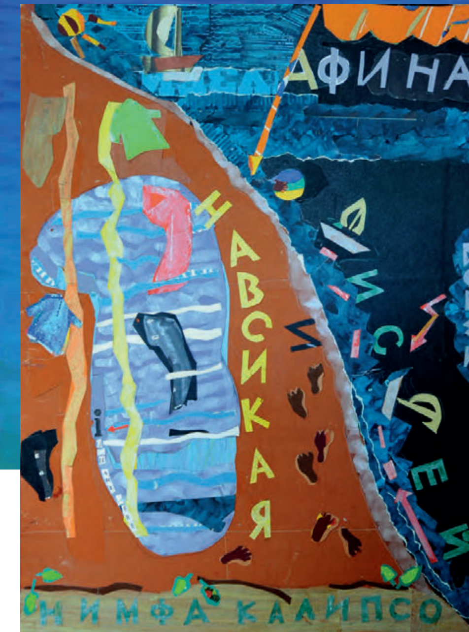
Одиссей и Навзикая. 1989, коллаж (бумага, гуашь), 80x60