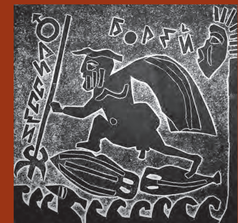
Одиссей и Борея. 1991, матричная гравюра, 35x35