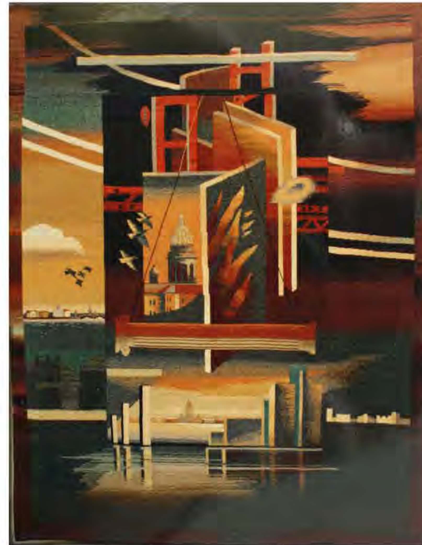
Марат Тажибаев 1990 «Переоценка ценностей» 185x175