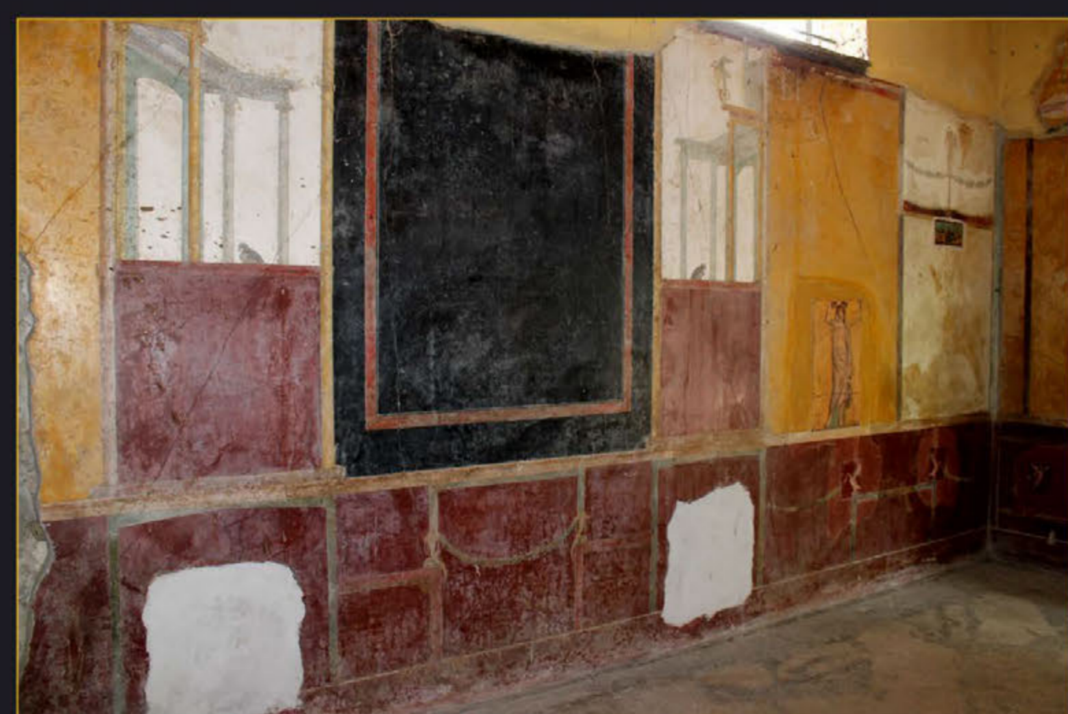
Рис. 4. Т.н. гостиная

Вилла Сан Марко – одна из крупнейших в Кампании, в окрестностях Неаполя. Она расположена близ современного небольшого города Каstellаммаре ди Стабия, в I веке н.э. там, на побережье, располагались загородные виллы римской аристократии. Среди них – вилла Сан Марко, которая интересна не только для археологов, до сих пор работающих там (следует отметить, что раскопки ее еще не завершены), но и для историков искусства в силу достаточной сохранности ее архитектуры, а особенно живописи, которая является основой монументальной декорации этого комплекса.