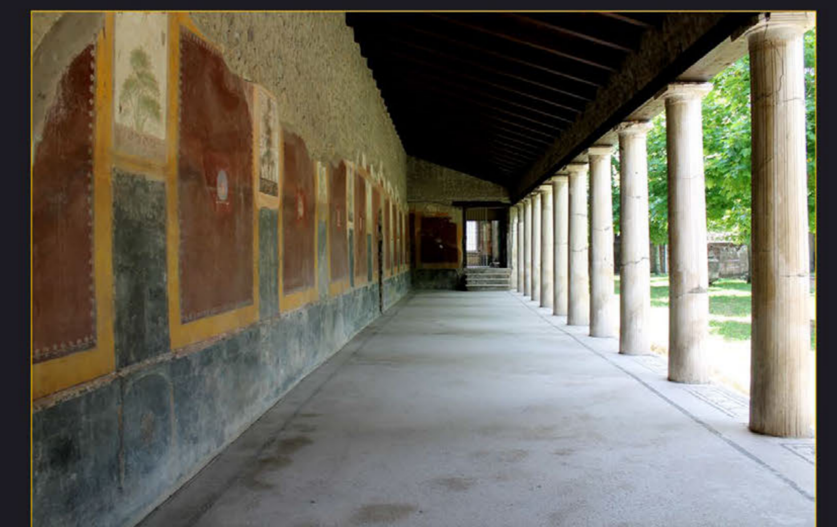
Рис. 9. Перистильный двор