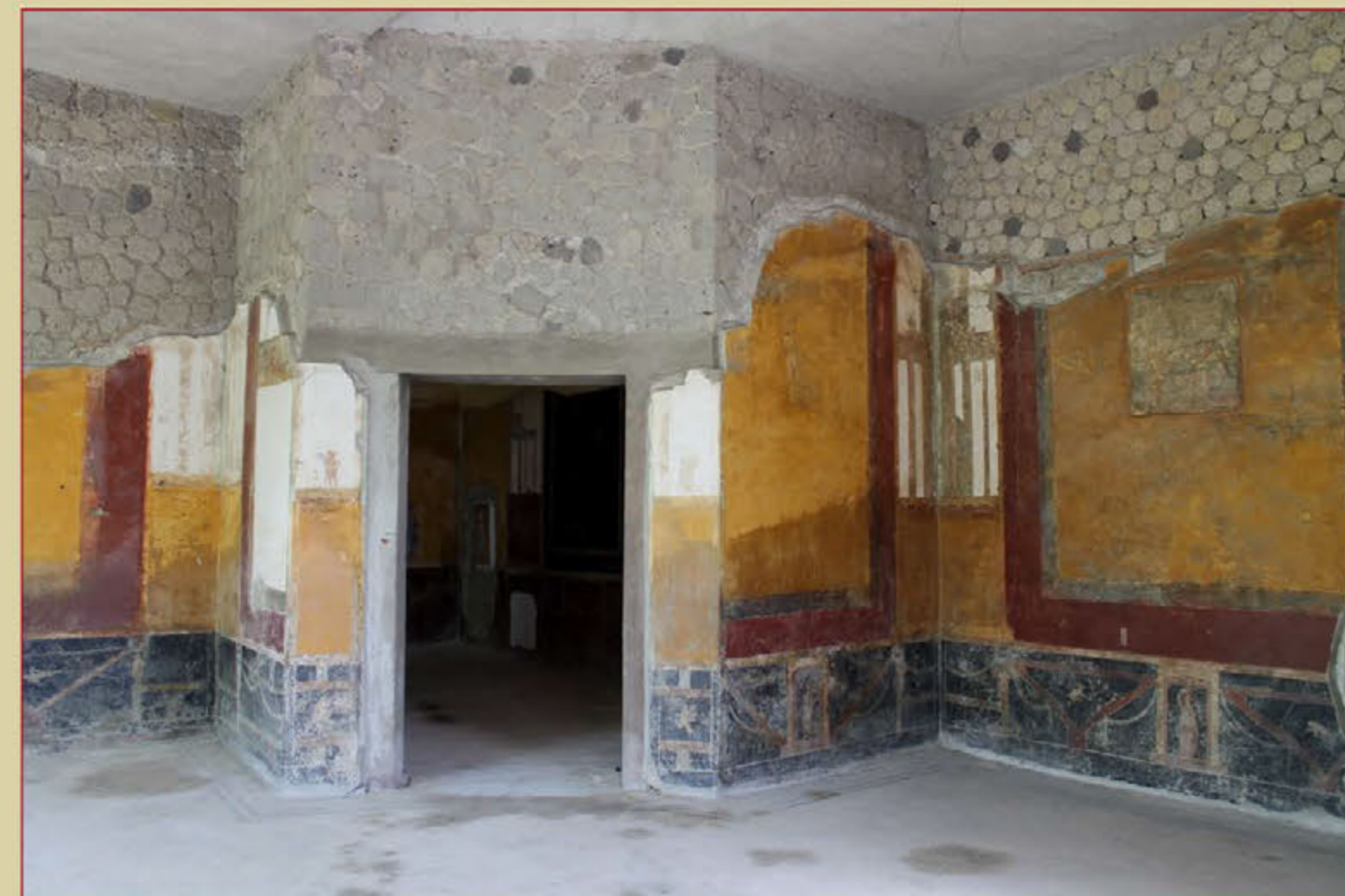
Рис. 2. Т.н. гостиная