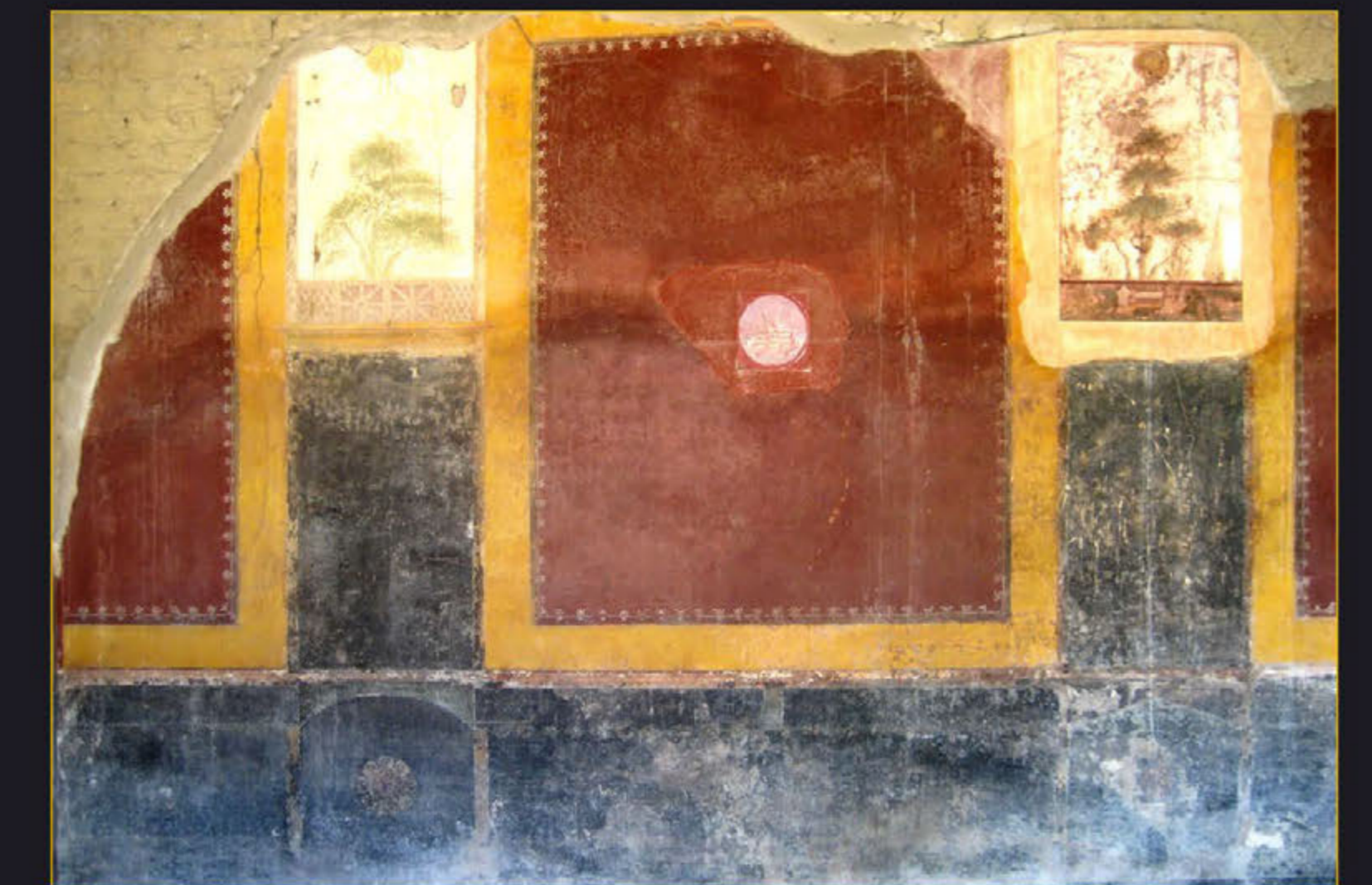
Рис. 8. Перистильный двор