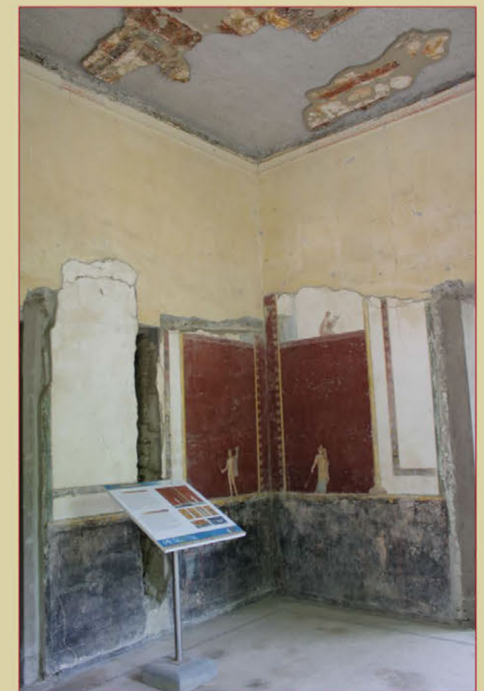
Рис. 7. Т.н. гостиная