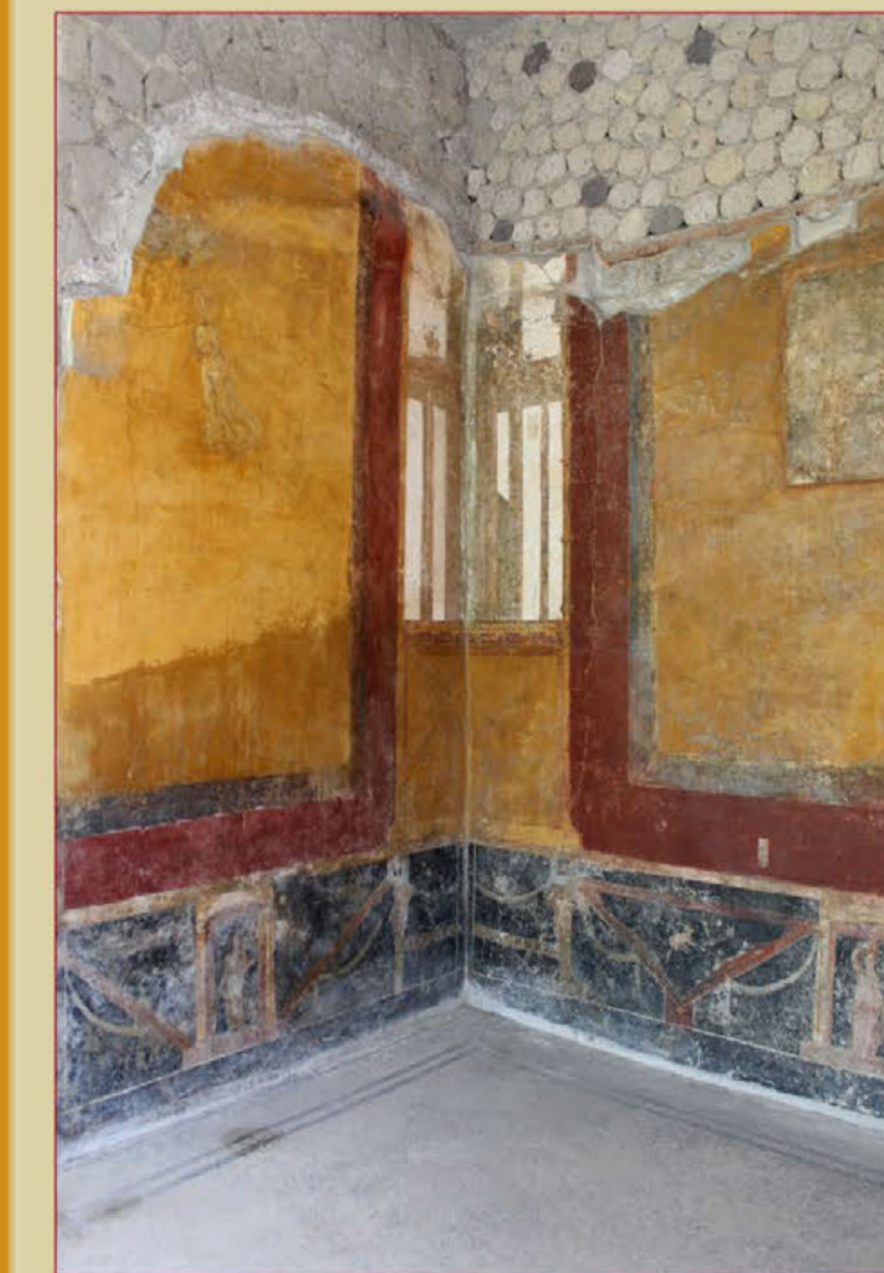
Рис. 6. Т.н. гостиная