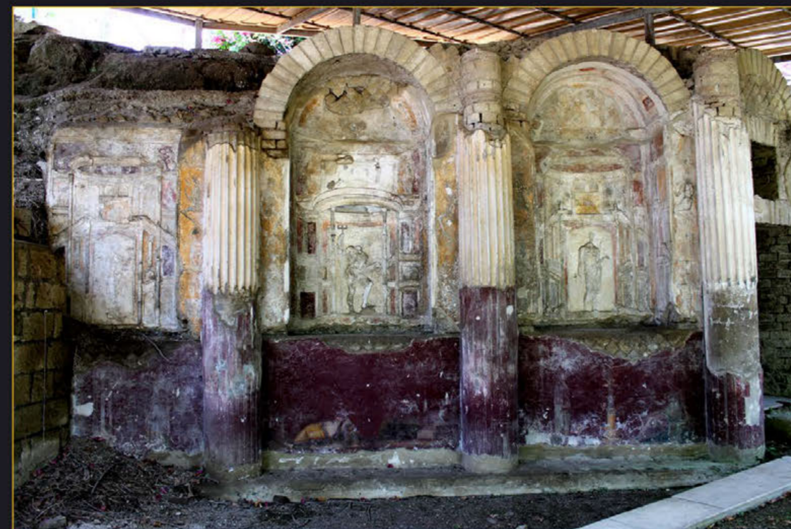
Рис. 3. Нимфей