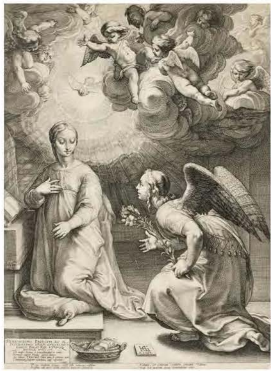
Х. Гольциус. Благовещение. Серия «Ранняя жизнь Марии». 1594. Резцовая гравюра на меди. Рейксмузеум, Амстердам. H. Goltzius. The Annunciation. Series «The Early Life of the Virgin». 1594. Cooper engraving. Rijksmuseum, Amsterdam.

The development of engravings from the Renaissance to the Mannerism and the early Baroque era is a pressing question, which remains significantly under researched by art historians. In the lecture this subject in multiple aspects: technique, art achievements and the use of engraving as a way to reproduce and duplicate other art objects. By examining the works of Dürer and Goltzius, we can clearly see the changes that happened during two centuries and also features that Mannerism retained without change since Renaissance.