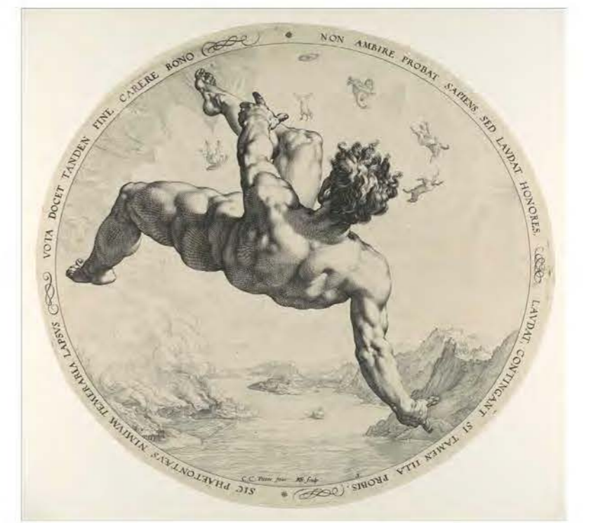
Х. Гольциус. Фэтон. Серия «Четыре падения». Резцовая гравюра на меди. 1588. Метрополитен-музей, Нью-Йорк. H. Goltzius. Phaeton. Series «The Four Disgracers». Cooper engraving. 1588. Metropolitan Museum of Art, New York.

Гравюра - важнейшее средство распространения визуальной информации в Европе Нового времени, оказавшее, так или иначе, влияние и на другие виды искусства. И Дюрер, и Гольциус становятся проводниками новых художественных форм в Западной Европе, отражают значимые аспекты искусства своего времени.