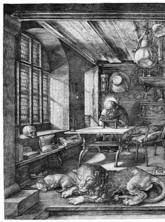
А. Дюрер. Святой Иероним в келье. Серия «Мастерские гравюры». Резцовая гравюра на меди. 1514. Гравюрный кабинет, Дрезден. A. Dürer. Saint Jerome in his Study. Cooper engraving. 1514. Collection of Prints, Drawings and Photographs, Dresden.