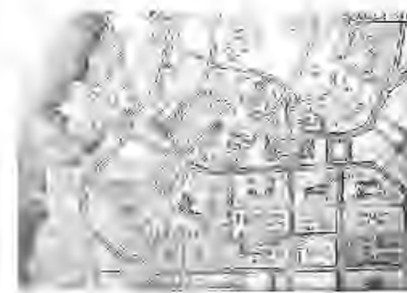
Конкурсный проект планировки и застройки Кречакивки. Киев. 1945 г.

Для Алёшина не существовало мелочей в проекте дома. Предметом «тщательного изучения и экспериментирования с целью отыскания лучших, удобнейших для человека решений» было всё — «от дверной ручки, тамбура и вестибюля, размеров и уклонов лестниц, формы поручня и до решения сложных задач композиции...». В архиве архитектора сохранилось множество документов, которые свидетельствуют о его скрупулёзности и педантичности — внимании даже к второстепенным деталям, а в списке проектов обращают на себя внимание разработки мебельных гарнитуров, фурнитуры, орнаментов, — Алёшин отводил деталям важное место в своей творческой деятельности.