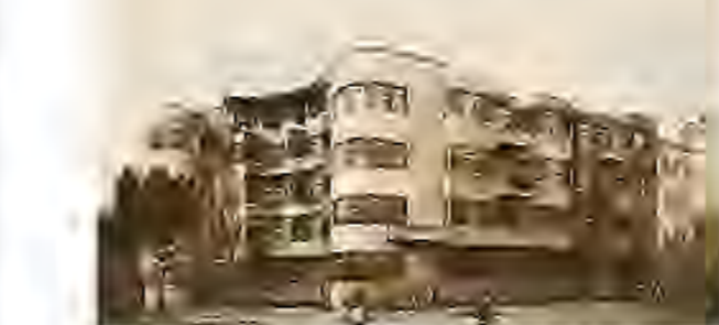
1-й жилой дом врача. Киев. 1928–1930 гг.